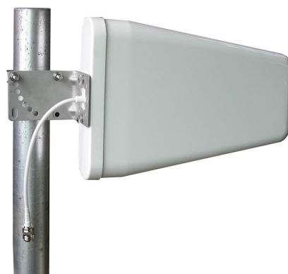
抱杆式安装示意图：